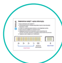
Schemat referencyjny (porównawczy) skali barw reakcji liniowej T