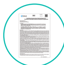
1 ulotka w języku polskim