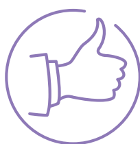
nieinwazyjny i komfortowy dla pacjentki