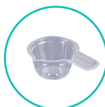
1 pojemnik na próbkę moczu