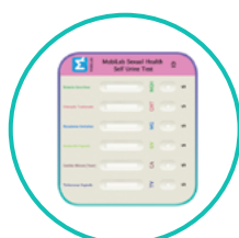
1 test zawierający kasetę testową combo 6 w 1