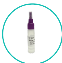
1 probówka ekstrakcyjna zawierająca 0,5 ml roztworu buforowego