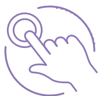
łatwy w wykonaniu

Zasada działania testu polega na jakościowym wykryciu antygenu w próbce moczu i wzrokowym odczycie wyniku na urządzeniu testującym – płytce testowej. Test MobiLab STI 6 w 1 należy do grupy testów szybkich. Wynik uzyskujemy w ciągu 15 minut.